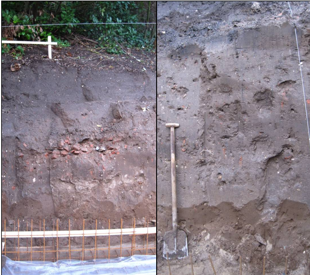
Afb. 3: links: overzicht putwand; rechts: detail putwand met onderin het esdek (beide foto's gezien richting het noordwesten)

Op basis van het noord- en oostprofiel kan aannemelijk worden gemaakt dat zich in de ondergrond van het plangebied een intact esdek heeft bevonden en zich deels nog steeds bevindt. Dit esdek kenmerkt zich als een egale bruine humeuze zandlaag met plaatselijk in de top fragmentjes baksteenpuin en houtskool.