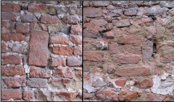
Afb. 5. Voorbeelden van enkele dichtgezette balkgaten.

Op een hoger niveau zijn vervolgens nieuwe balkgaten ingehakt ten behoeve van het opleggen van moerbalken. Boven dit vloerniveau is de muur voorzien van een witte bepleistering. Een medewerker van de aannemer (A. van Engelenhoven en zonen b.v. uit Ede) gaf te kennen dat het gesloopte pand aan deze zijde een eigen zijgevel bezat die naast de zijgevel van Molenstraat 21A was geplaatst. De geconstateerde rijen van balkgaten behoren dus tot twee voorgaande bouwfasen waarin de muur als 'gemene muur' functioneerde. Wellicht dat men voorafgaand aan het plaatsen van de zijgevel van Molenstraat 23 de buitenzijde aan de onderkant van de zijgevel van Molenstraat 21A iets heeft teruggehakt om de tussenruimte zoveel als mogelijk te verkleinen.