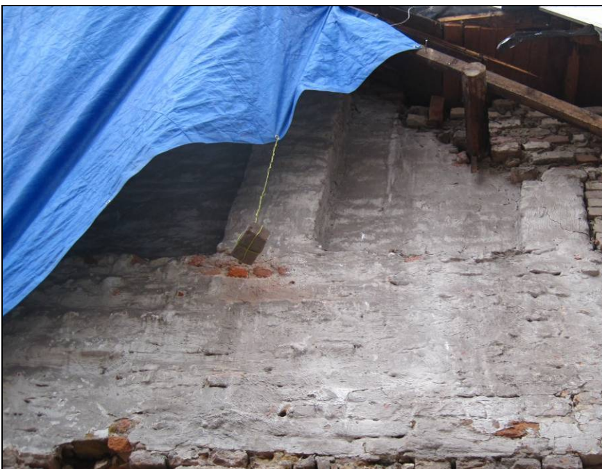
Afb. 6. De ingekorte daklijn ter hoogte van de bakstenen kolommen (locatie schouw?).

Op een hoger niveau is goed te zien dat de gevel terugspringt en dat zich in de (vermoedelijke) as van de gevel twee bakstenen kolommen bevinden (afb. 6). Het is verleidelijk om hierin schouwwingen te zien, maar deze interpretatie is niet zeker. Eventuele roetaanslag is namelijk niet (meer) zichtbaar omdat de gevel bepleisterd is. Tevens is de relatie met het vloerniveau niet waarschijnlijk omdat de wangen dan te hoog geplaatst zouden zijn geweest. Aan de achterzijde van Molenstraat 21A is recentelijk een dakkapel geplaatst. Hierbij is een deel van de oude gevel weggebroken. De huidige daklijn van 21A lijkt niet tot de aanlegfase van het gebouw te behoren want het was duidelijk te zien dat men deze heeft ingekort.