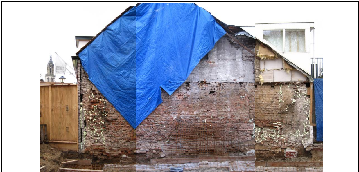
Afb. 4. Compositiefoto muurwerk Molenstraat 21A (gezien richting het zuidwesten)

De oostgevel van het naastgelegen pand Molenstraat 21A viel op omdat deze een flinke ouderdom uitstraalde (afb. 4). De gevel was dermate 'wrak' dat de aannemer, om nog enige samenhang in het metselwerk te verkrijgen, er toe was overgegaan om de kieren op te vullen met polyurethaanschuim (PUR-schuim). Plaatselijk waren tevens poeren ter ondersteuning gemetseld. De muur heeft een huidige lengte van 10 meter. Het is niet duidelijk of dit ook de oorspronkelijke lengte is. De gevel stond iets uit het lood (hellend naar het noordwesten). De bakstenen zijn in wild verband gemetseld met behulp van lichtgrijze en bruingrijze schelpkalkmortel. De bakstenen zijn onregelmatig van vorm, zachtgebakken en in het formaat 25/27 x 13 x 5/6 cm uitgevoerd. De tienlagenmaat is gemiddeld 71,25 cm (vier metingen). Navraag bij dhr. B. Olde Meierink van het Bureau voor Bouwhistorie en Architectuurgeschiedenis (BBA) wijst uit dat de muur op basis van deze tienlagenmaat en de baksteenformaten vermoedelijk in de tweede helft van de 14 e eeuw is te plaatsen. De muur is vermoedelijk eensteens breed en op staal gefundeerd. De fundering sprong beneden het maaiveld enkele centimeters uit. Dit is veroorzaakt door het feit dat men de stenen vanaf het toenmalige maaiveld heeft ingehakt en onder dit niveau niet.