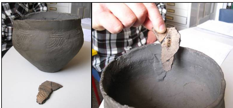
Afbeelding 2: de aangevulde en overgeschilderde urn met het missende fragment.

Zonder dat met het achterhalen van deze koppelingen serieus begonnen was, werd alvast één geval aangetoond en één geval opgelost. Een ongenummerde, met gips aangevulde en vervolgens bijna geheel overgeschilderde(!), urn werd weer herenigd met een onder een nieuw nummer in een museumvitrine aanwezig fragment van diezelfde urn die op dat gedeelte met gips was opgevuld (zie afbeelding 2). De koppeling van deze urn met een van de 147 beschreven vondstmeldingen moet echter nog worden uitgezocht. Hierbij kan vooral de versiering van de urn een bruikbaar aanknopingspunt vormen.