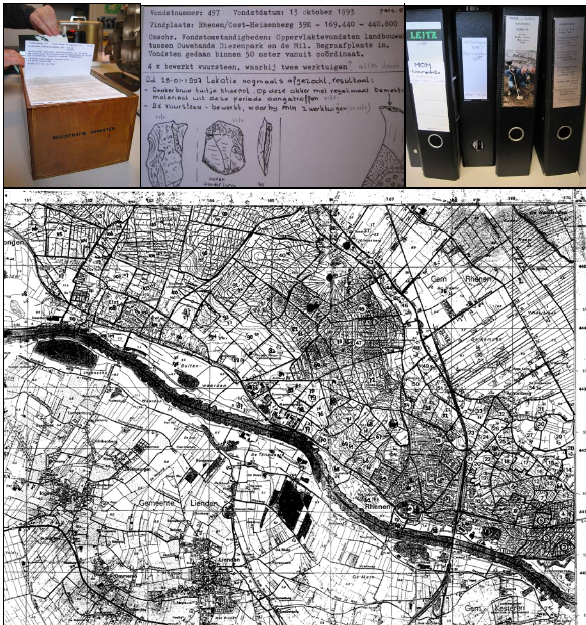
Afbeelding 1: De vondstadministratie van dhr. Mom (vondstkaartjes, mappen en overzichtskaart met vondstlocaties).