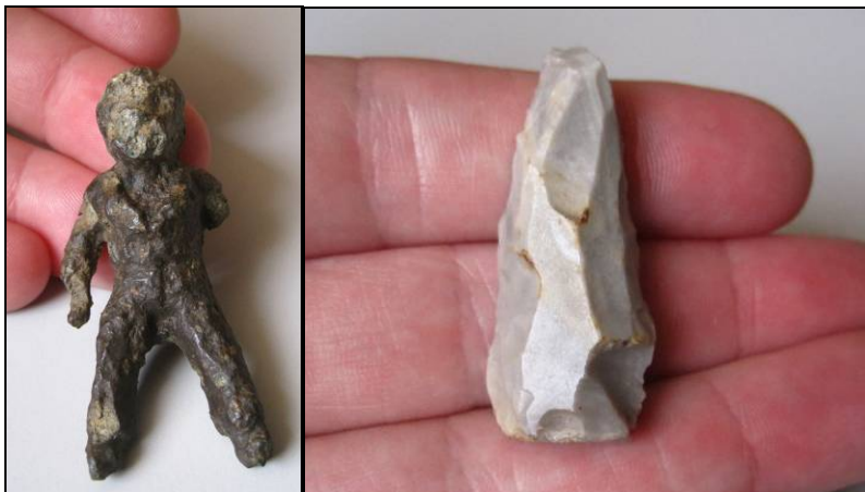
Afbeelding 3: enkele illustratieve vondsten uit de collectie Mom. Linkerzijde: vermoedelijk Romeins(?) beeldje, gemaakt uit een koperlegering; rechterzijde: jongpaleolithisch vuurstenen werktuig, waarschijnlijk een vuurslag.

Een belangrijk deel van de inventarisatie betrof de bewerking van de gegevens van de collectie Mom, die eveneens tot de museumcollectie behoort. Het leeuwendeel van het vondstmateriaal bestaat uit metaal en bewerkt vuursteen (zie afbeelding 3). Als eerste werd begonnen met een administratieve controle van deze gegevens, waarbij werd bekeken welke daarvan reeds in Archis waren opgenomen. Bij de 40 vondstnummers waarvoor dit gold, werd dit alsnog op de oorspronkelijke vondstkaarten aangegeven. De mappen met aanvullende informatie over delen van de collectie werden doorgenomen, waarna bij vondstnummers waar dit van toepassing was, op de oorspronkelijke vondstkaarten verwijzingen naar deze mappen werden aangebracht.